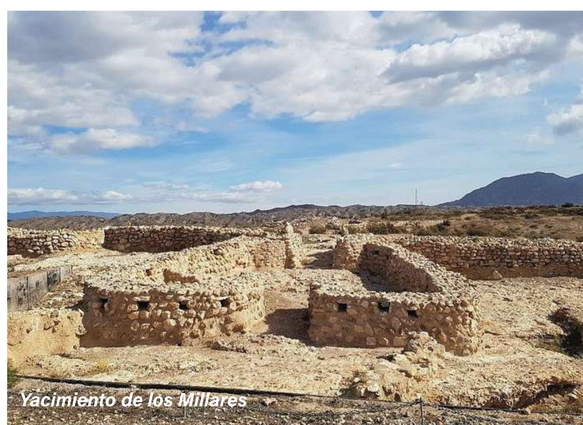
Yacimiento de los Millares