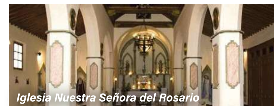
Iglesia Nuestra Señora del Rosario