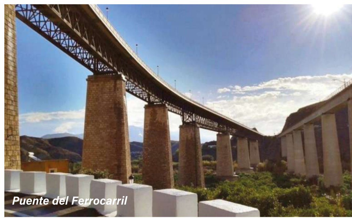
Puente del Ferrocarril